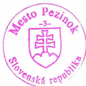
Oliver Solga Mgr. Oliver Solga primátor mesta

Toto rozhodnutie má povahu verejnej vyhlášky v zmysle § 26 zákona. č. 71/1967 Zb. o správnom konaní a musí byť vyvesené po dobu 15 dní na úradnej tabuli Mesta Pezinok v mieste obvyklým spôsobom a taktiež je zverejnené aj na internetovej stránke Mesta Pezinok – www.pezinok.sk . Posledný deň tejto lehoty je dňom doručenia.