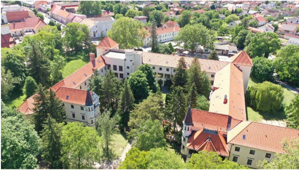
Park sa bude revitalizovať v súlade s požiadavkami pamiatkovej ochrany