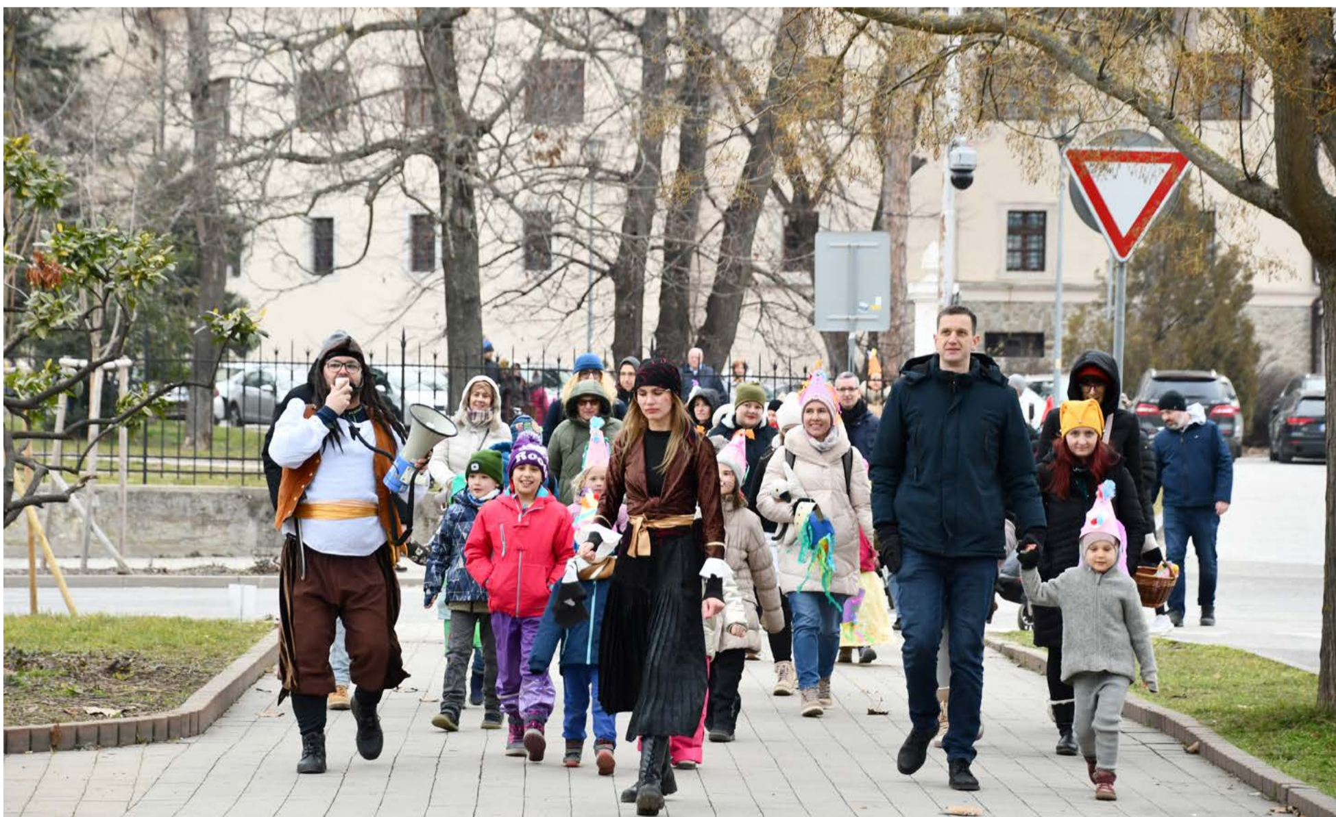
Fašiangový sprievod zo Zámockého parku na Radničné námestie