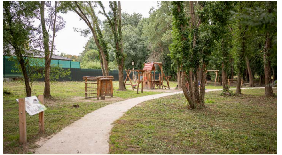
Priestor sa zmení na atraktívne prostredie na oddych