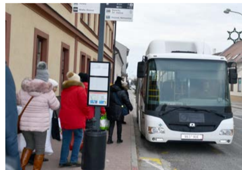
Najviac cestujúcich sa v januári odviezlo 15. (1 025) a 30. 1. (1 025)