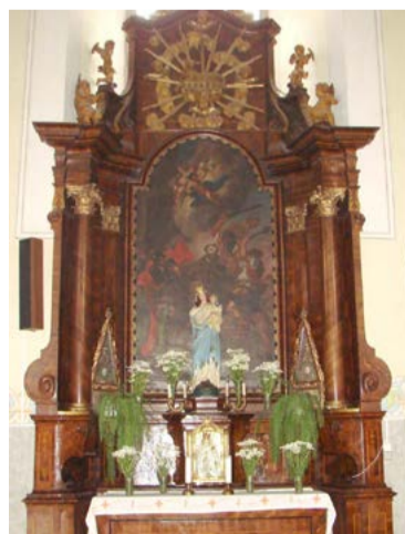
Oltár sv. Fidela v kapucínskom kostole

Petra Pospeschová, Mestské múzeum v Pezinku