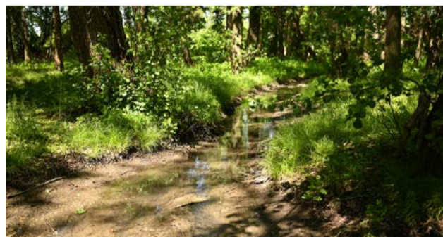
Obnovou prejdú vodné toky a plochy