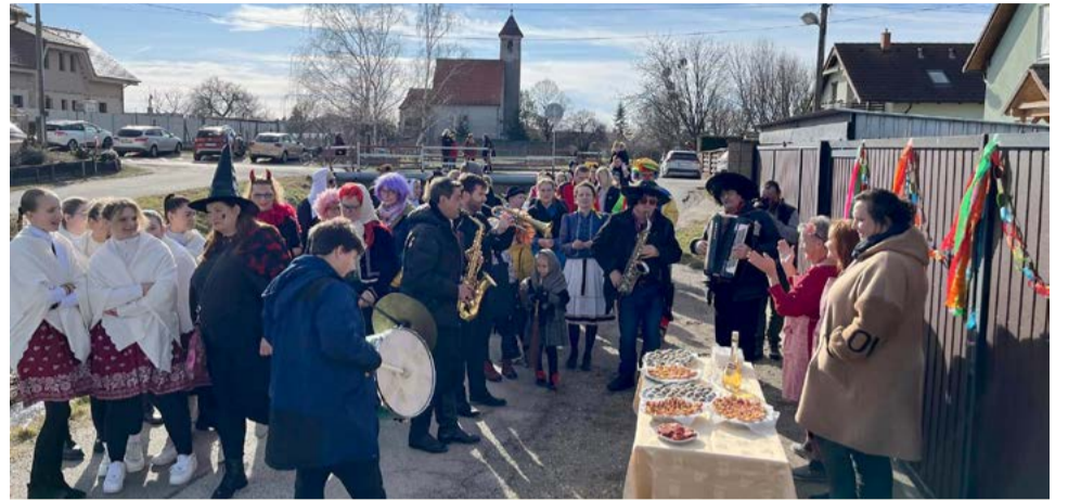
Snímka z minuloročného sprievodu masiek v Grinave