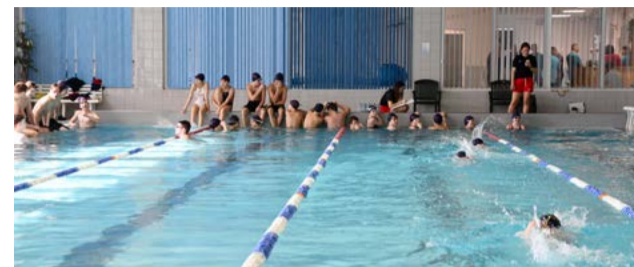
Mesto pozýva na plavecký maratón