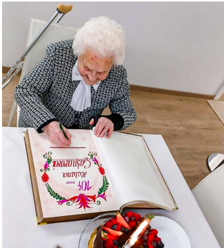
Významné jubileum je zaznamenané aj v kronike mesta