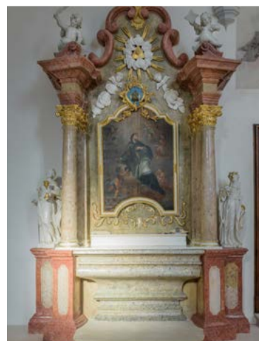
Oltár sv. Jána Nepomuckého vo farskom kostole