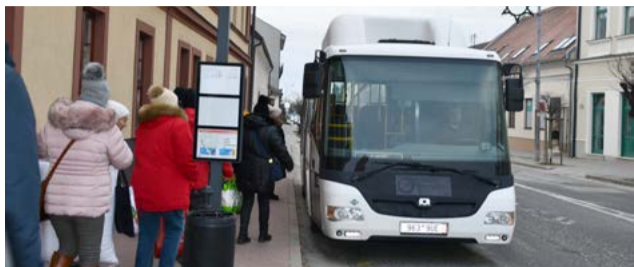
Záujem o autobusovú dopravu výrazne stúpol