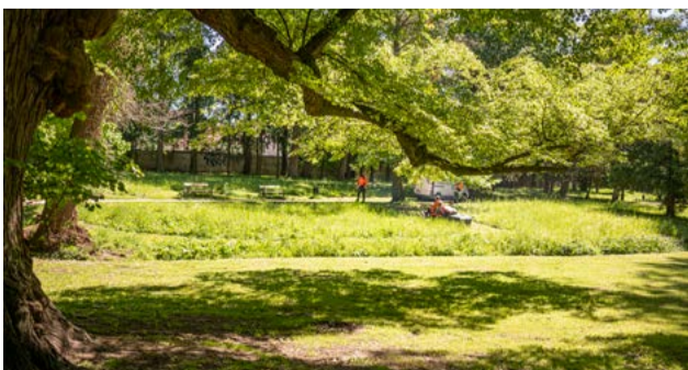
Župa kladie dôraz na vyčistenie prehustených okrajov parku od nepôvodných drevín