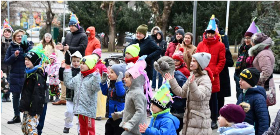
Deti na hudobno-tanečnom programe v centre mesta