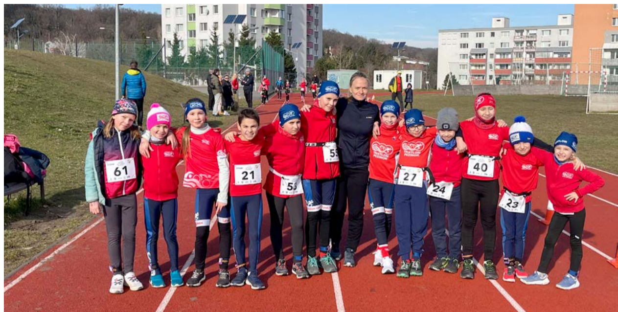
Pezinskí triatlonisti na zimnom akvatlone v Bratislave