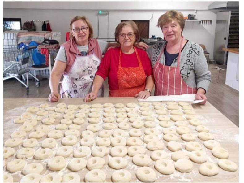
Členky Denného centra na Cajlanskej ulici napiekli viac ako 200 šišiek