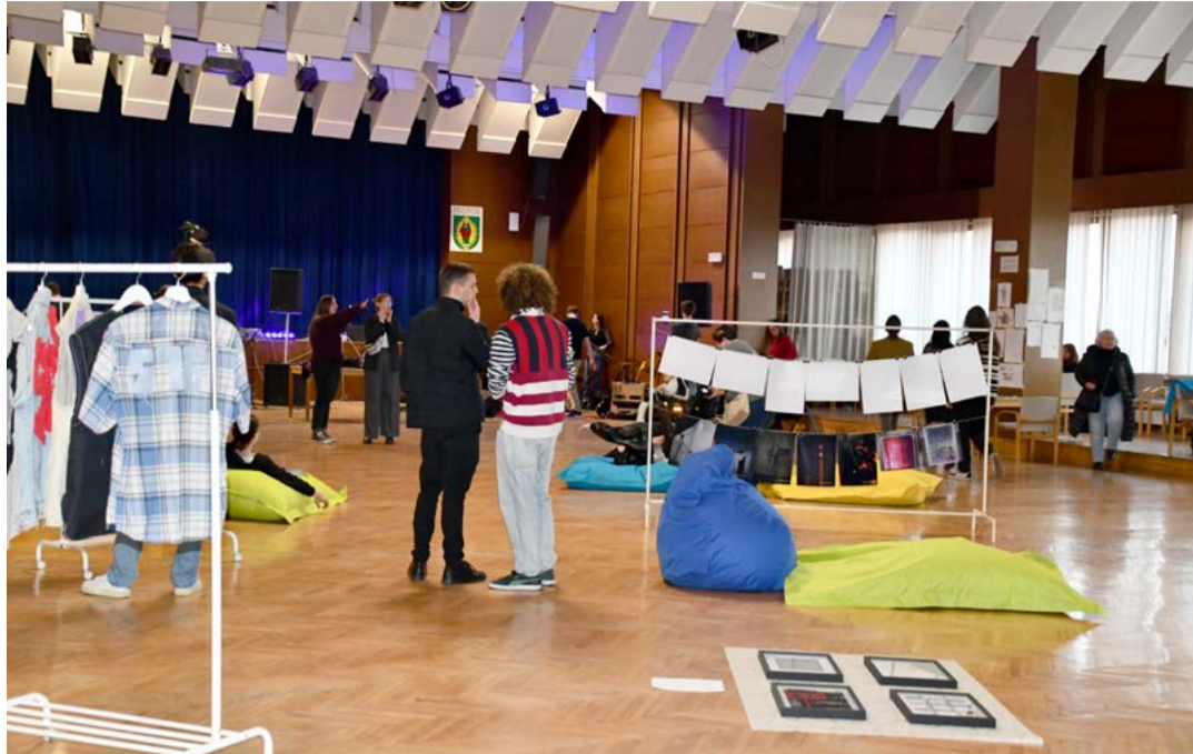
Výstava ponúkla rozmanité formy umenia