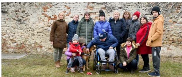
Sociálnou rehabilitáciou k vyššej kvalite života