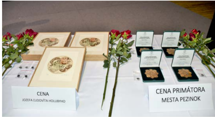
Slávnostné odovzdávanie ocenení sa uskutoční 14. júna

Cena primátora mesta Pezinok – cena je udeľovaná občanom mesta Pezinok, občanom iných miest a cudzím štátnym príslušníkom a právnickým osobám, ktoré vo svojom odbore prispeli výnimočným spôsobom k rozvoju alebo propagácii mesta Pezinok. Cenu udeľuje primátor mesta Pezinok