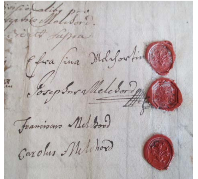
Podpisy a pečate Melchordtovcov na dokumente o del'be majetku