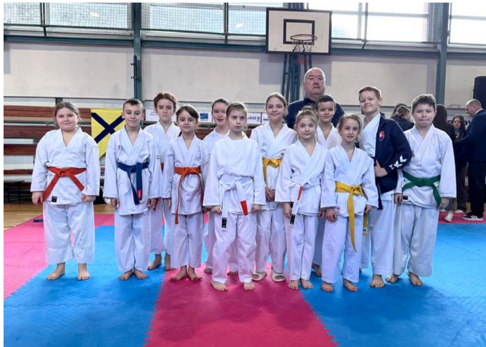
Karatisti priniesli tri zlaté, päť strieborných a osem bronzových medailí