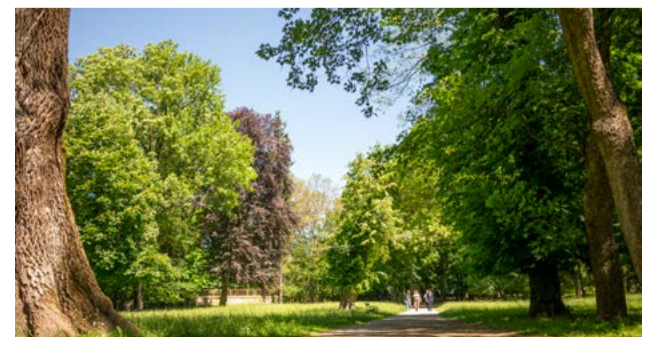
Doplnené budú historicky pôvodné dreviny