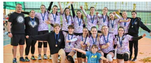
Mladšie žiačky vybojovali postup na majstrovstvá Slovenska