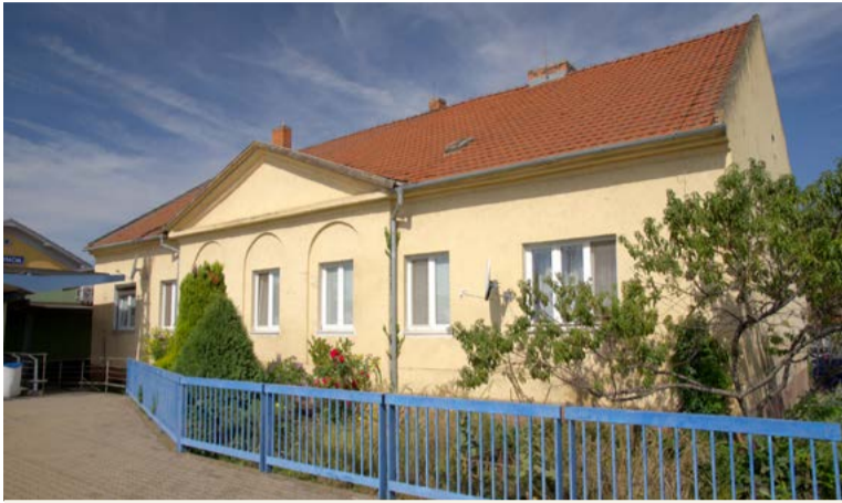
Stanica konskej železnice