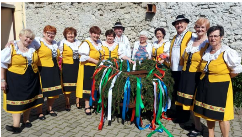
K aktivitám členov klubu patrí zachovávanie tradícií, napríklad aj stavanie mája