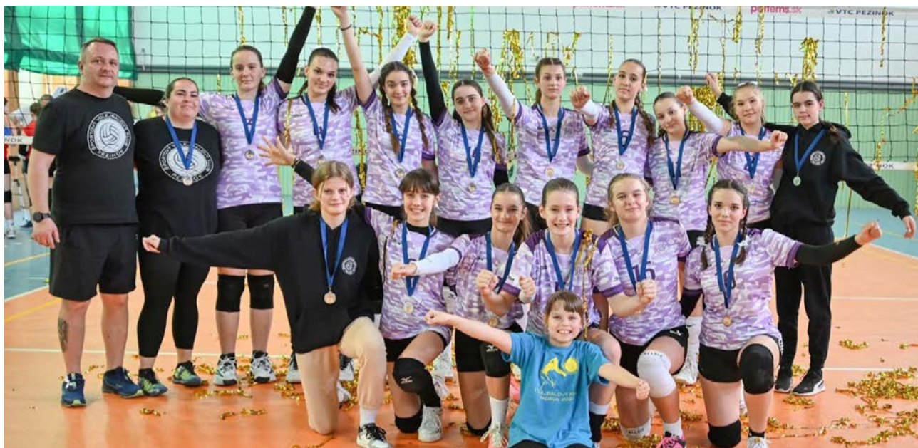
Na finálovom turnaji majstrovstiev Slovenska si mladšie žiačky zahrajú koncom mája