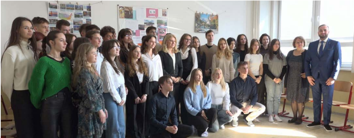
Prezidentka diskutovala so študentmi o aktuálnych problémoch životného prostredia