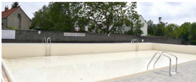
Letné kúpalisko ponúkne v novej sezóne väčší komfort