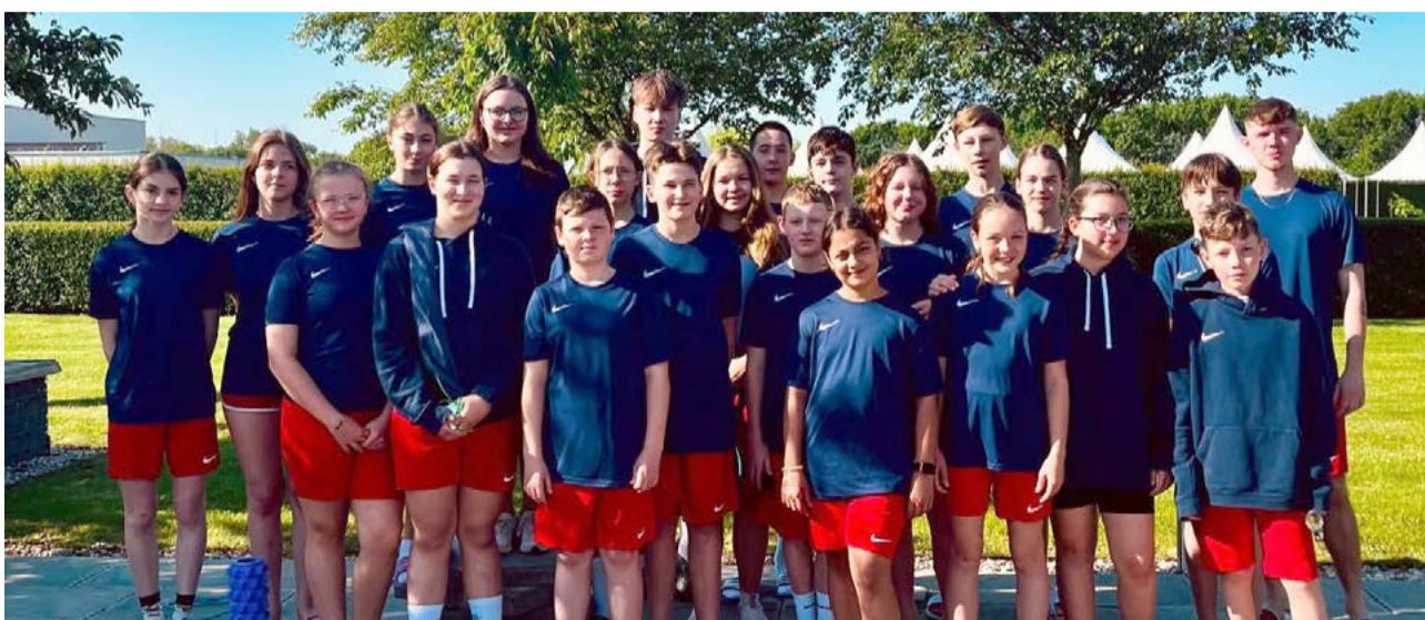
Mladší plavci na pretekoch v Šamoríne