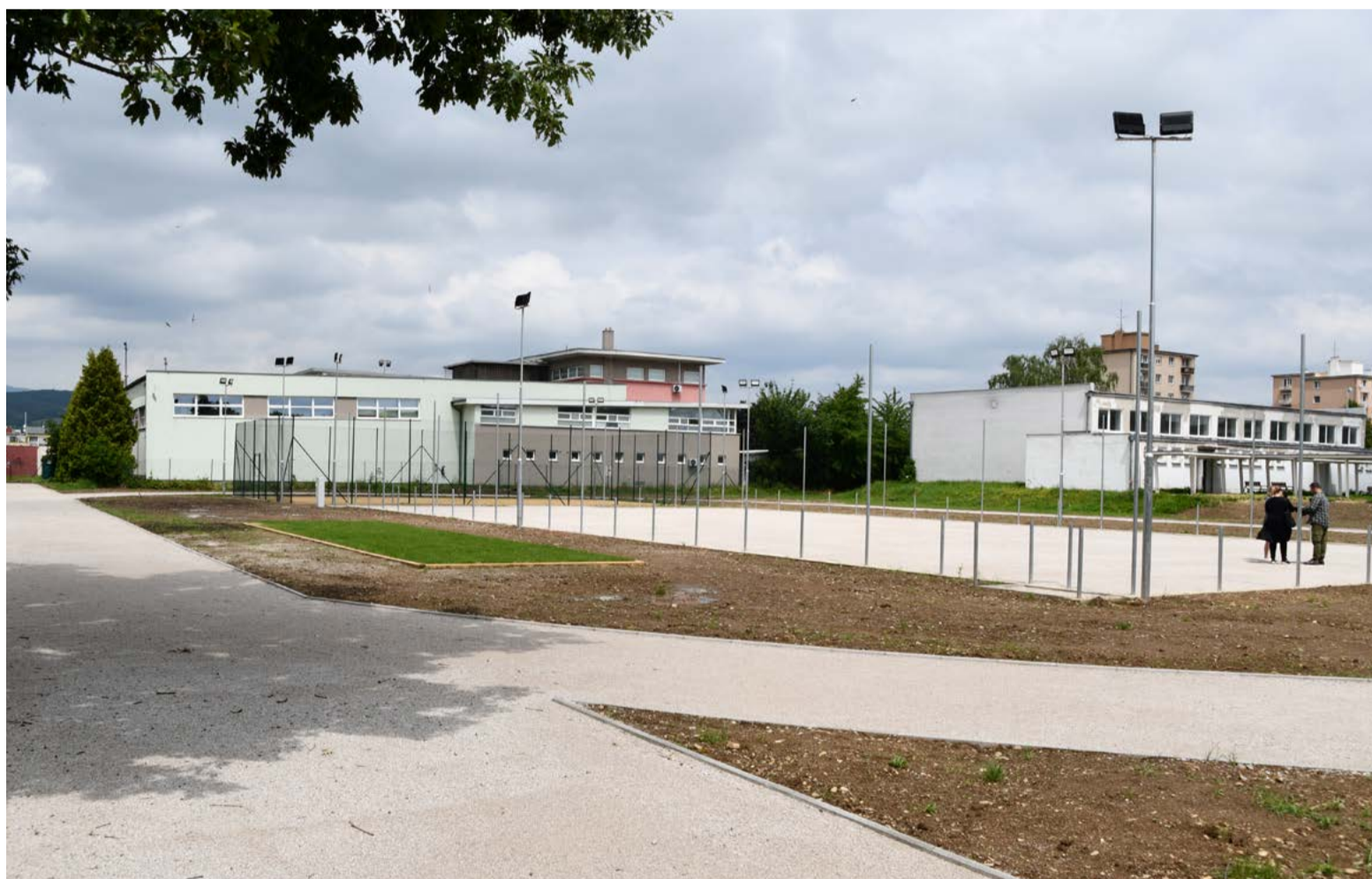
Multifunkčné ihrisko bude slúžiť širokej verejnosti. Práce by mali byť ukončené do konca júna

„Hrubú stavbu jednotlivých ihrísk máme dokončenú. Dokončené máme volejbalové a petangové ihrisko. Boli zhotovené jednotlivé základové a lemovacie konštrukcie, oplotenie aj osvetlenie volejbalového ihriska s ochranným pletivom a bol navezený piesok. Na multifunkčnom ihrisku sú prevedené jednotlivé podkladové vrstvy finálneho povrchu, nosná konštrukcia pre mantinelový systém a montáž umelého osvetlenia. Na tartanovej bežeckej dráhe máme zhotovené lemy bežeckej dráhy z betónových obrubníkov a rovnako