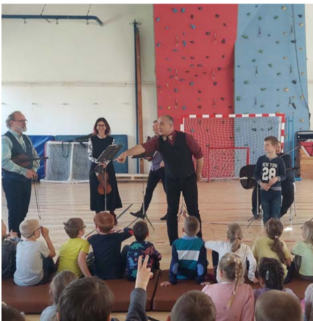
Žiaci sa učili o hudbe zábavnou formou