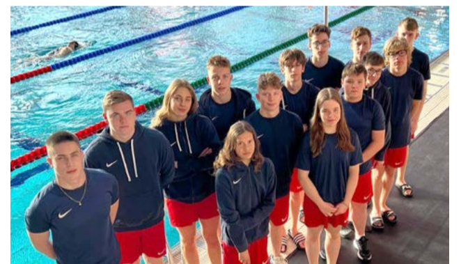
Starší plavci na medzinárodných pretekoch vo Viedni