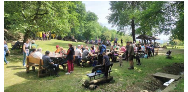
Chodník je značený zelenobiелou banskou značkou