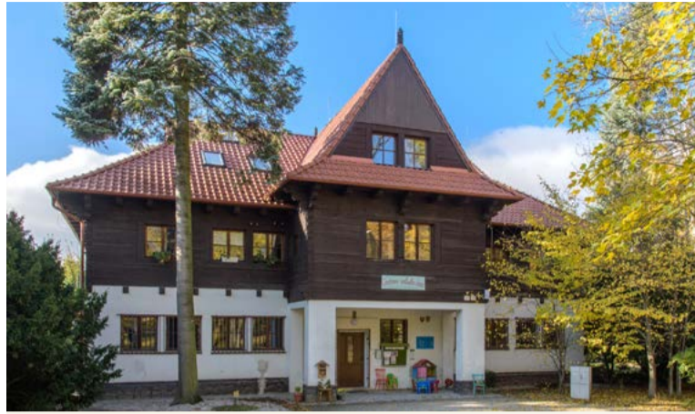
Vstupná reprezentatívna fasáda budovy CVČ