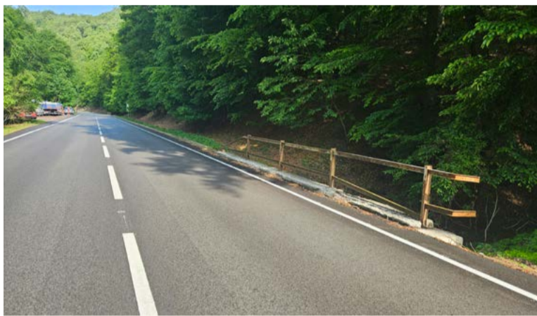
Predmetom rekonštrukcie je kompletná výmena mostného zvršku a príslušenstva mosta

Správca župných komunikácií II. a III. triedy v Bratislavskom kraji na základe vykonanej diagnostiky začal s rekonštrukciou viacerých mostných objektov. Správa ciest Bratislavského samosprávneho kraja (BSK) začala práce na moste medzi Zohorom a Lábom a rovnako rozbieha aj prestavbu dvoch mostov na Pezinskej Babe.