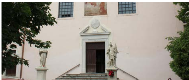
Významné jubileum - 350. výročie príchodu kapucínov do Pezinka