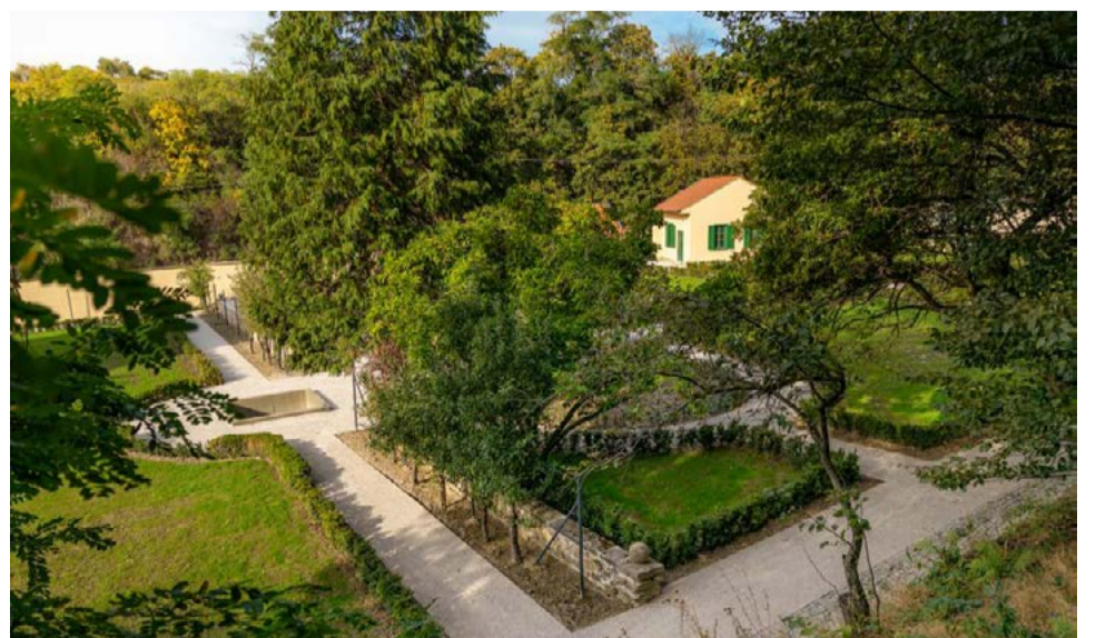
Pripravená je aj komentovaná prehliadka záhrady