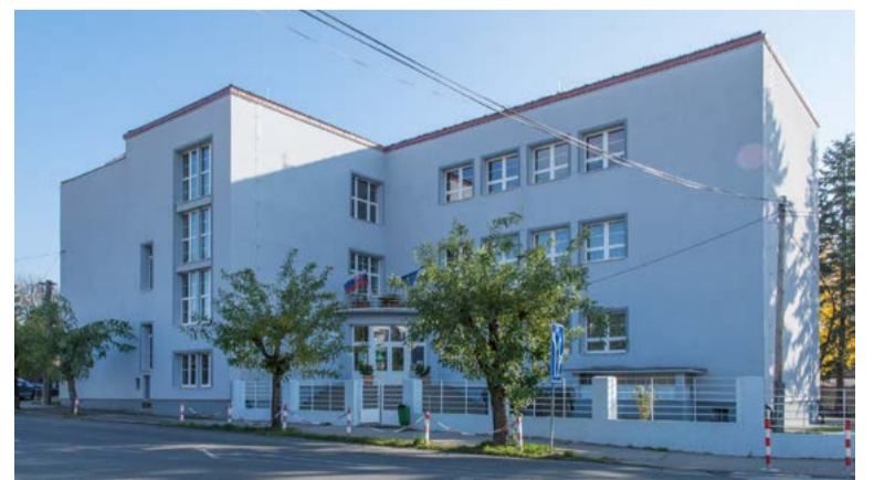
Pôvodne budova meštianskej školy, dnes gymnázium

Text a foto: Eduard Zvarik, Mestské múzeum v Pezinku