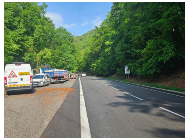
Na Pezinskej Babe sa rozbieha prestavba dvoch mostov