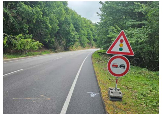
Doprava bude riadená pomocou svetelnej signalizácie