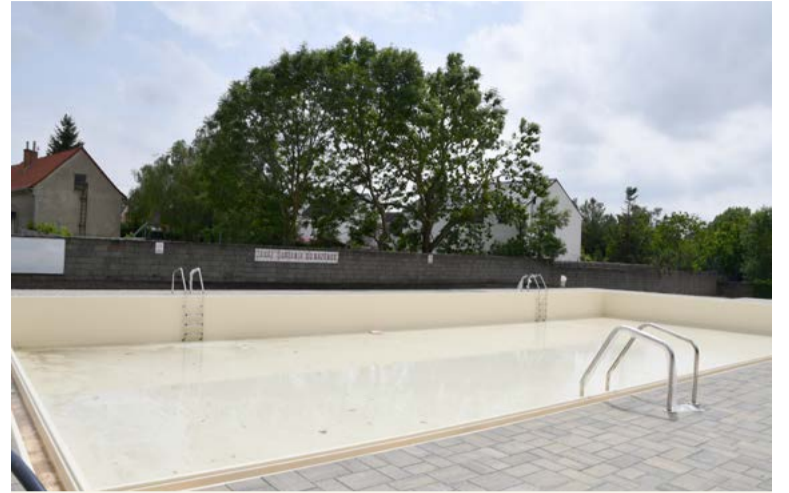
Voda v plaveckom bazéne bude vyhrievaná na 26 stupňov Celzia

Kompletne zrekonštruované boli aj sociálne zariadenia, zároveň pribudli toalety pre imobilných. Aktuálne vykonáva Mestský podnik služieb sadové úpravy,