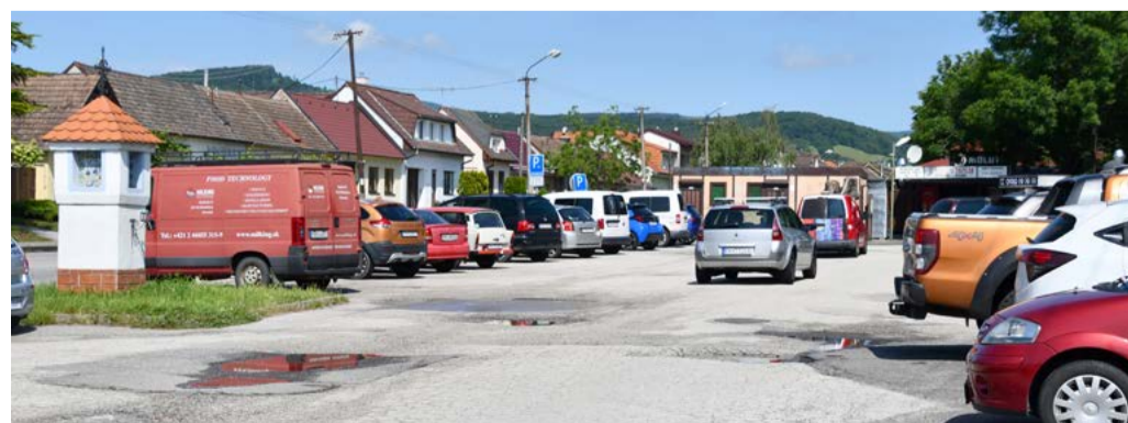
Asfaltový betón bude nahradený drenážnou zámkovou dlažbou